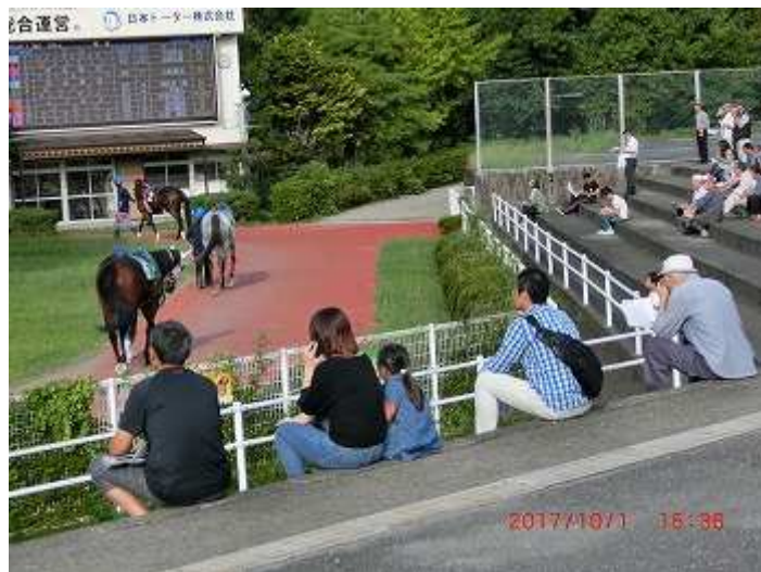
(パaddockにおいて馬さんの調子を見る)

地方競馬では、競馬開催により得られる収益金をもって畜産振興を図るなど公益的役割を担っております。