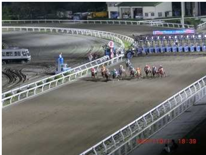
(ナイターでも場内は明るい)

当日、「高知けいば」では、第1レースを14時45分スタートとし、最終の第12レースを20時50分スタートとしておりましたので、ナイターも楽しめました。