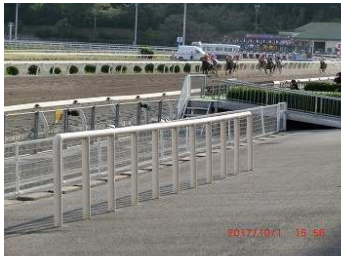
(最終コーナーまわってゴール目指してまっしぐら)

当協会では、毎年、「高知けいば」において個人協賛レースを行っておりますが、今年は10月1日（日）に実施いたしました。