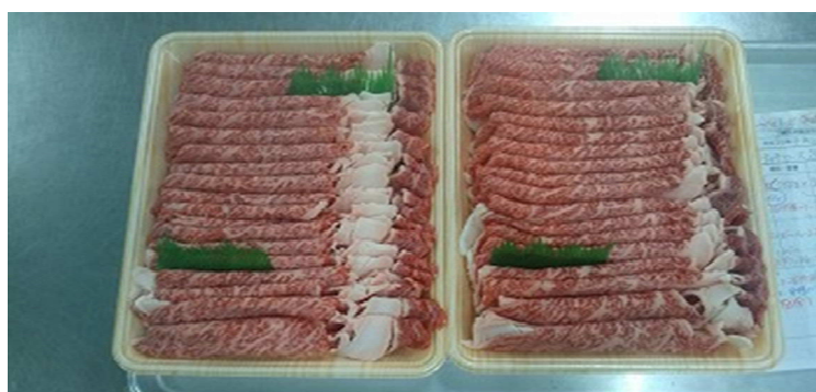
贈った副賞（しまね和牛肉）